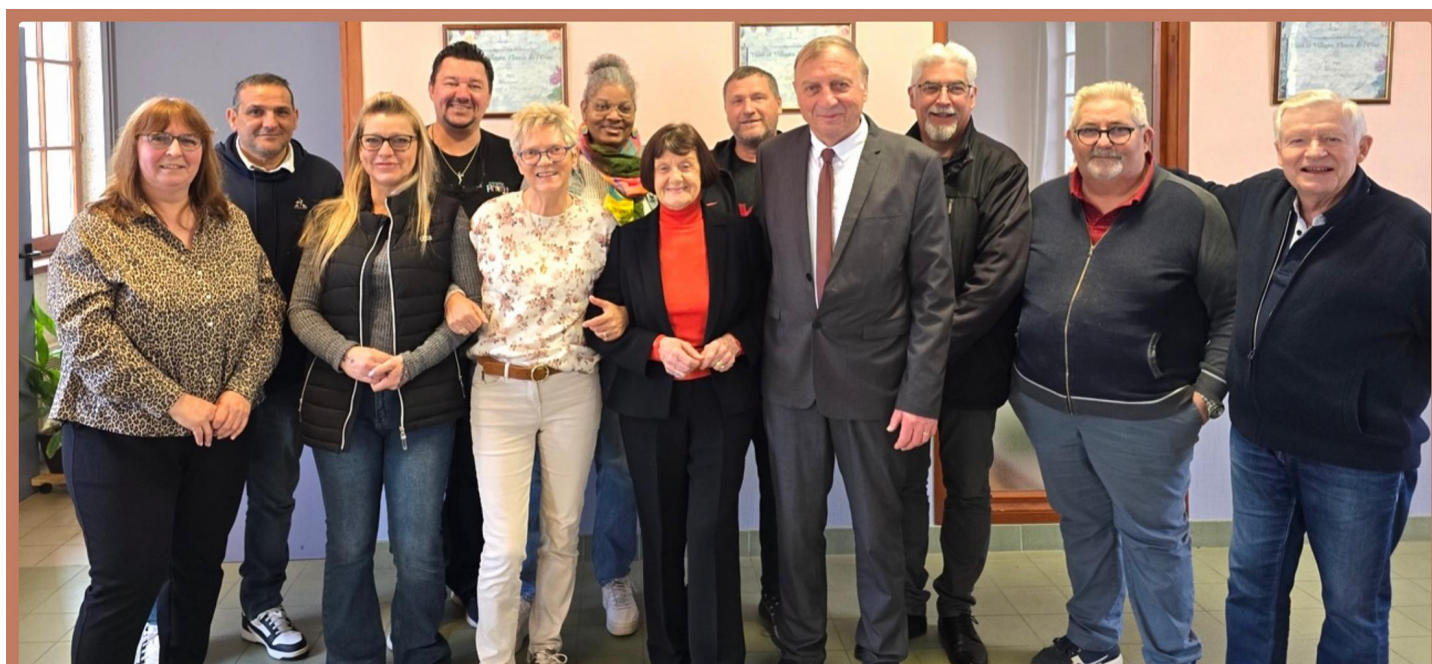
Photo de l'équipe municipale suite au premier conseil municipal du dimanche 22 mars 2026