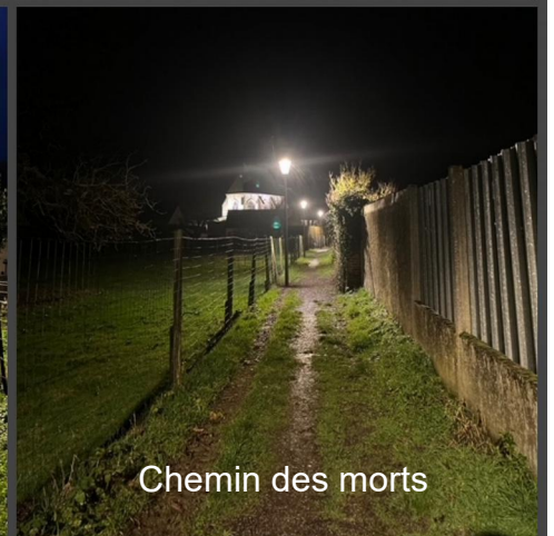
Chemin des morts