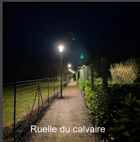
Ruelle du calvaire

Le nom du dernier chemin n'étant pas très joyeux, nous envisageons de le rebaptiser prochainement.