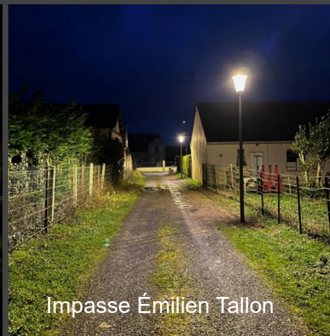
Impasse Émilien Tallon