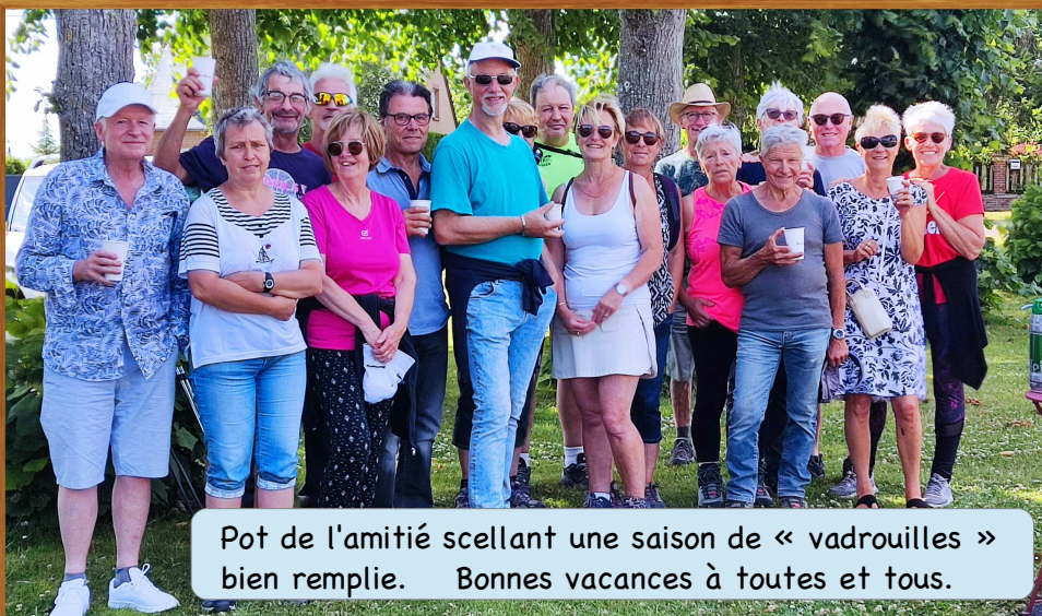
Pot de l'amitié scellant une saison de « vadrouilles » bien remplie. Bonnes vacances à toutes et tous.