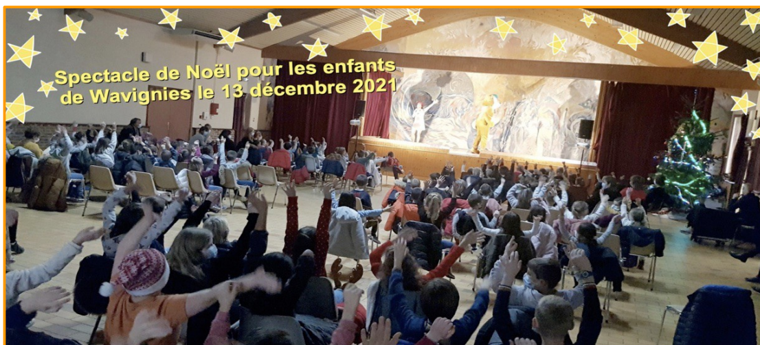
Spectacle de Noël pour les enfants de Wavignies le 13 décembre 2021

Les enfants ont assisté à un spectacle musical interactif. Ils chantaient, tapaient des mains, levaient les bras au rythme des chansons devant des personnages illustrant chaque chanson. Les enfants ont beaucoup aimé ce spectacle de Noël offert par la municipalité et sont repartis avec des étoiles plein les yeux.