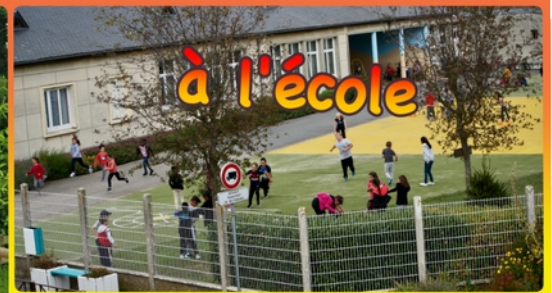
Initiation au tir à l'arc à l'école pour les élèves de CM1 et CM2 le 18 juin 2021