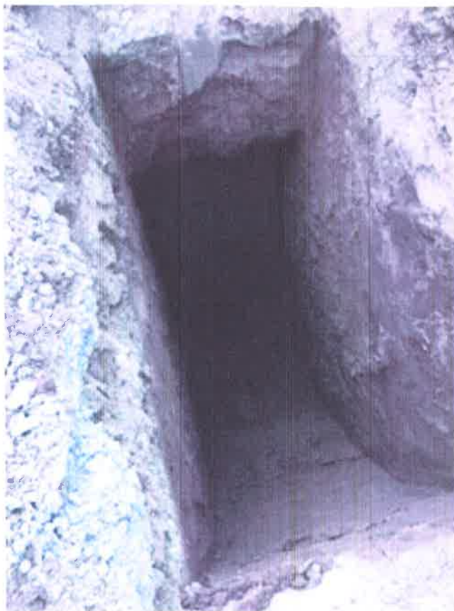
Fosse n° 3 - Déblais limono-argileux