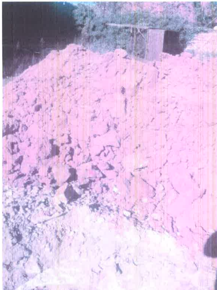
Fosse n° 1 – Déblais limono-argileux