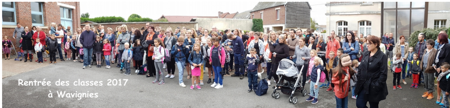
Rentrée des classes 2017 à Wavignies

149 enfants se sont retrouvés dans la cour de l'école le lundi 4 septembre où ils ont été accueillis par M. Renaux et les enseignants.